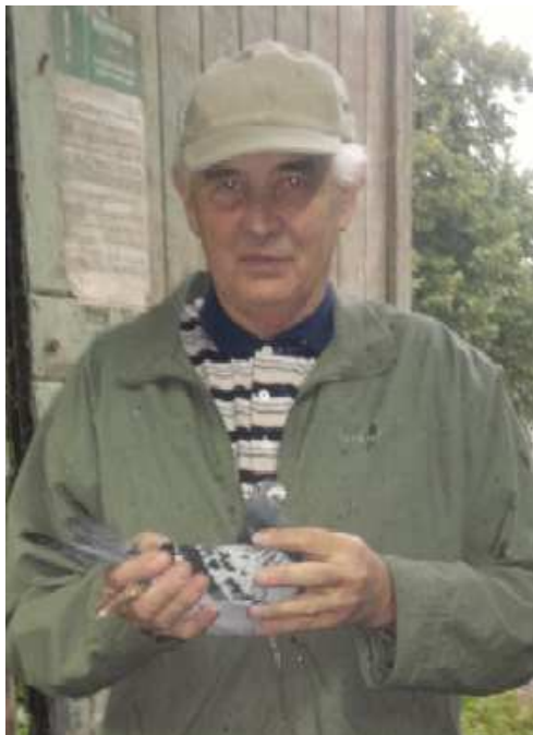
Foto s vítězem závodu Aschaffenburg, holub 11-066-1116

Do dalších let mu přejí hodně zdraví ,štěstí a chovatelských úspěchů kamarádi ZO Kutná Hora