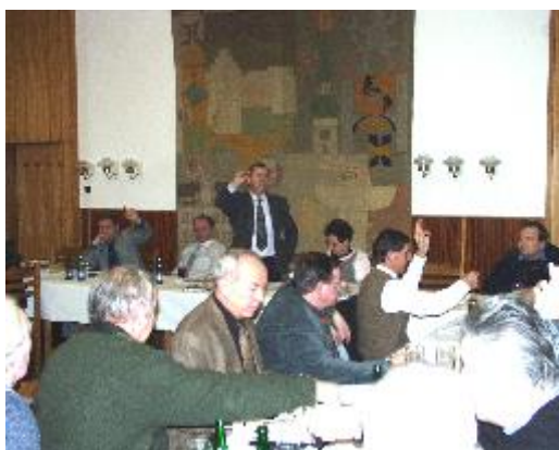
Hlasování při konferenci delegátů CHPH