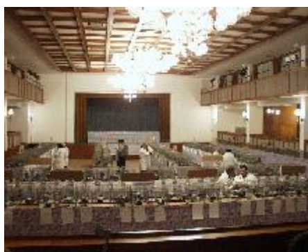
Posuzovatelé při práci

chovatelství chovatele, který by po dobu 50ti roků udržel svůj chov standardních holubů na tak špičkové úrovni jako pan Kopálek. Hluboce se před tímto panem chovatelem skláním a přeji mu dobré zdraví a ještě hodně chovatelských úspěchů.