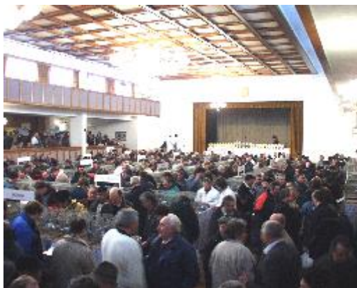
Výstavní sál v sobotu dopoledne

Sobota je hlavním dnem pro otevření výstavy divákům. Výstavy se zúčastnil nečekaně vysoký počet návštěvníků. Přesto, že počasí nebylo zrovna ideální, přijel snad největší počet za poslední roky. Bude výstavní sál a přilehlé společenské prostory stačit na tak vysoký počet návštěvníků? Bude zajištěno dostatečné občerstvení? Bude možno si v pohodě podebatovat s přáteli, které vidáme jednou za rok právě na CV? Toto všechno bylo sledováno s určitým napětím. Sobotní průběh výstavy ukázal, že výstavní plocha je dostačující, ale společenské prostora a především možnosti občerstvení na takový počet návštěvníků nestačí. To však nebyl problém jenom letošní celostátní výstavy. Tyto problémy, především s občerstvením, byly i na předešlých CV, výjimkou je pouze Hluk. Mimo uvedených potíží s občerstvením byla sobota bez problémů, trochu ale zamrzelo, že v katalogu výstavy bylo na vloženém listě s výsledky kategorií standard uvedeno špatné pořadí soutěže OS.